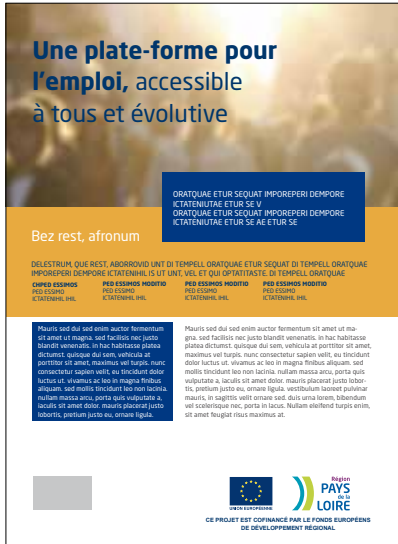
Exemple de site web